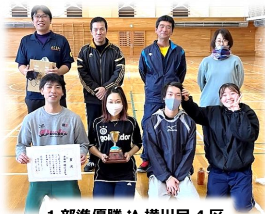
1部準優勝 横川目4区