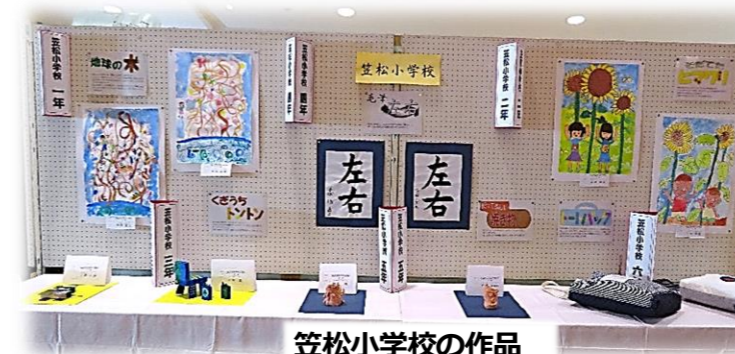
笠松小学校の作品