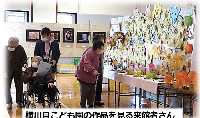
横川目こども園の作品を見る来館者さん