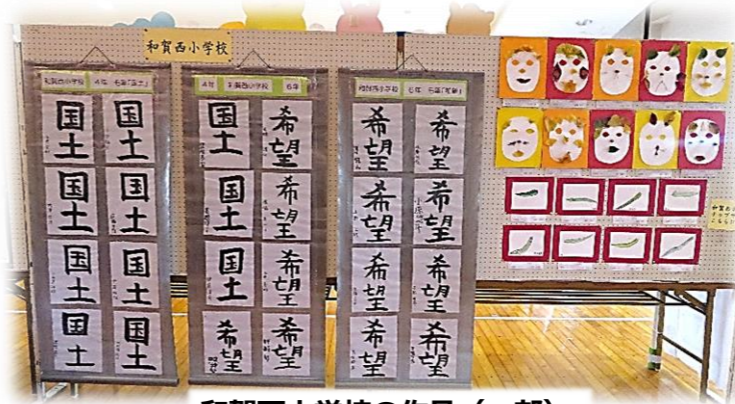
和賀西小学校の作品(一部)