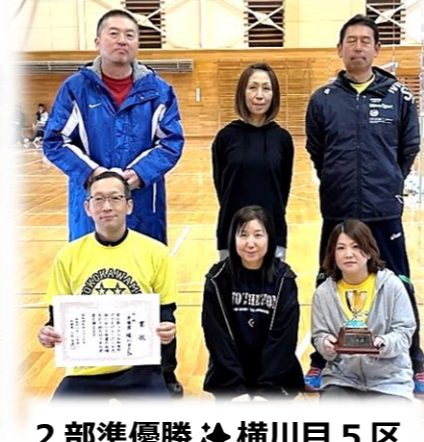
2部準優勝 横川目5区