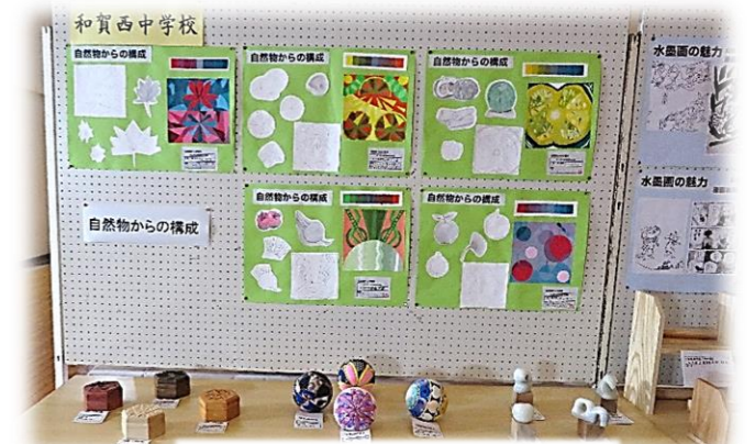
和賀西中学校の作品(一部)